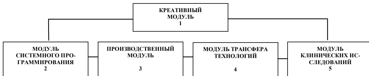
Рис.1. Структура кластера трансляционной медицины для реализации проекта

Функционально каждый модуль относился к тем или иным подразделениям высших учебных заведений Белгорода, Ростова-на-Дону, Курска, а также предприятий города Курска: