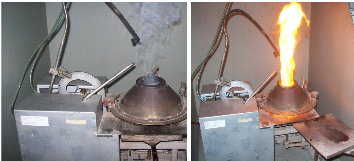
Рис. 1. Экспериментальные исследования воспламеняемости ЛГМ

Проведены экспериментальные исследования по определению особенностей воспламенения типичных ЛГМ сосновых насаждений под воздействием лучистого теплового потока в средневозрастных сосновых насаждениях [4]. После определения веса при естественной влажности образцы были высушены в сушильном шкафу до абсолютно сухого состояния (при температуре 105 °С). Экспериментальные исследования проводились на установке для испытаний на воспламеняемость при плотности теплового потока 15–45 кВт/м 2 , что соответствует температуре нагревательного элемента радиационной панели установки 412–658 °С (рис. 1) [9].