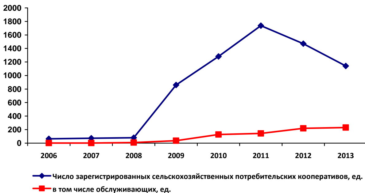
Рисунок 1 – Динамика численности сельскохозяйственных потребительских кооперативов в Пензенской области

Районы с низкой плотностью (менее 10 жителей на кв. км) отсутствуют, но больше половины муниципальных образований относятся к категории с пониженной плотностью населения (10-15 чел. на кв. км). При этом наиболее населенными являются районы, имеющие крупные административные центры: Каменский (60,7 тыс. жителей), Пензенский (52,5 тыс. жителей), Городищенский (51,6 тыс. жителей), что говорит о концентрации сельских жителей вокруг городов. В зависимости от заселенности территории в районах варьируется количество личных подсобных хозяйств – от 5 до 20 тысяч, а также крестьянских (фермерских) хозяйств и ИП, занимающихся сельскохозяйственным производством – от 25 до 200. При этом в значительном количестве сельских населенных пунктов крупное аграрное производство отсутствует, сельскохозяйственные организации и предприятия перестали функционировать, а жители не могут трудоустроиться и соответственно не имеют необходимых доходов. Многие вынуждены развивать собственное подсобное хозяйство, организуют крестьянские (фермерские) хозяйства и потребительские кооперативы. В данных условиях развитие сельскохозяйственных потребительских обслуживающих кооперативов на территории Пензенской области показывает положительную динамику (рисунок 1). По результатам обследования, только 12% из них занимается оказанием консультационных и информационных услуг.