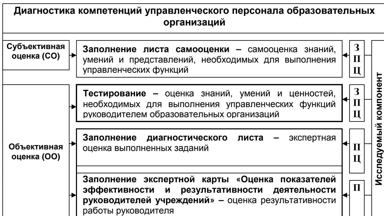
Рис.2. Процесс диагностики компетенций управленческого персонала образовательных организаций [4]

Так как управленческая компетентность явление интегративное, то для всесторонней диагностики компетенции управленческого персонала необходим комплекс инструментов, способствующих выявлению уровня развития компетентности руководителей образовательных организаций. Процесс диагностики компетенций управленческого персонала образовательных организаций представлен на рисунке 2.