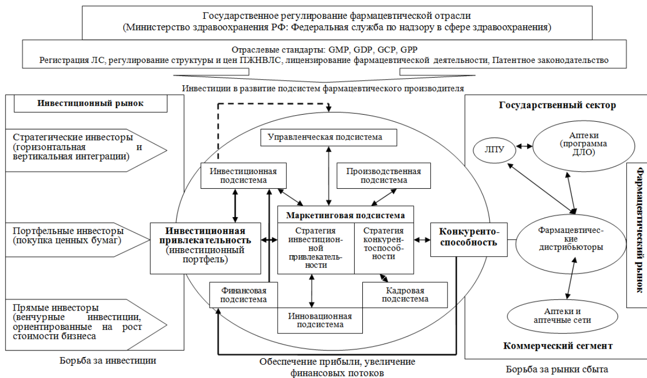
Рис. 1 Концепция влияния маркетинговой подсистемы предприятий фармацевтической промышленности на их инвестиционную привлекательность

детерминирует рост ценовой конкуренции на рынке лекарственных средств (ЛС), снижающий доходность модели фармбизнеса, основанной на реализации стратегии производства и маркетинга традиционных медикаментов (анальгин, цитрамон, активированный уголь, аспирин и др.). Поэтому наиболее привлекательным является формирование продуктового портфеля на основе дифференцированных фармпродуктов и, в первую очередь, посредством разработки новых лекарственных формул и / или модификации существующих (совершенствование средств их доставки в органы и ткани, создание пролонгированных форм, снижение аллергенности и токсичности и др.).