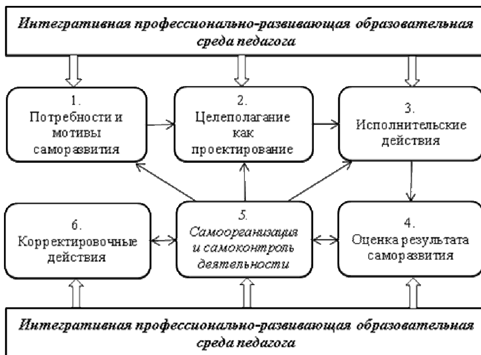
Рис. 2. Влияние интегративной профессионально-развивающей образовательной среды на процессуальные компоненты саморазвития педагога

Функция в общем значении – явление, зависящее от другого и изменяющееся по мере изменения этого другого явления. В этом аспекте личностно-профессиональное саморазвитие педагога зависит от условий интегративной образовательной среды и изменяется под воздействием ее факторов. Интегративная образовательная среда выполняет побудительную, прогностическую, результативную, аналитическую, регулятивную функции в личностно-профессиональном саморазвитии педагога.