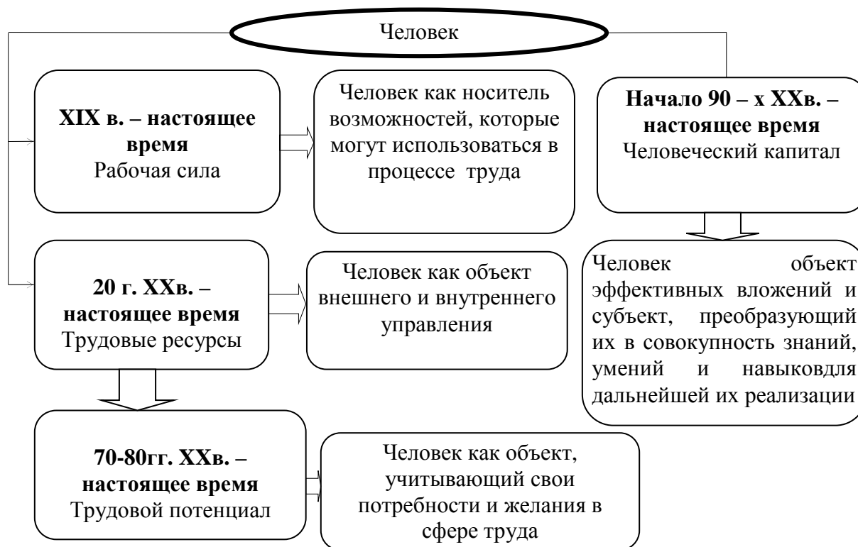
Рис. 1. Взаимосвязь понятий, используемых в трудовой деятельности

Для формирования и использования человека как важнейшего компонента трудовой деятельности необходимо определить его место в системе экономических категорий, традиционно используемых в российской экономической науке (рис. 1).