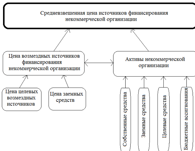
Рис. 1 - Модель оптимизации структуры источников финансирования некоммерческой организации

Авторская модель оптимизации структуры источников финансирования выглядит следующим образом: